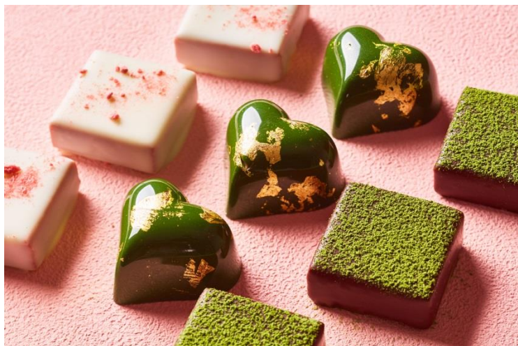
桜色と抹茶のグリーンのコントラストは桜の木をイメージ

販売期間：2020年4月23日(木)まで 場所：ザ・ショップ N.Y.ラウンジブティック