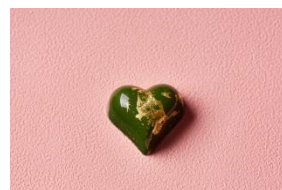
抹茶生キャラメル