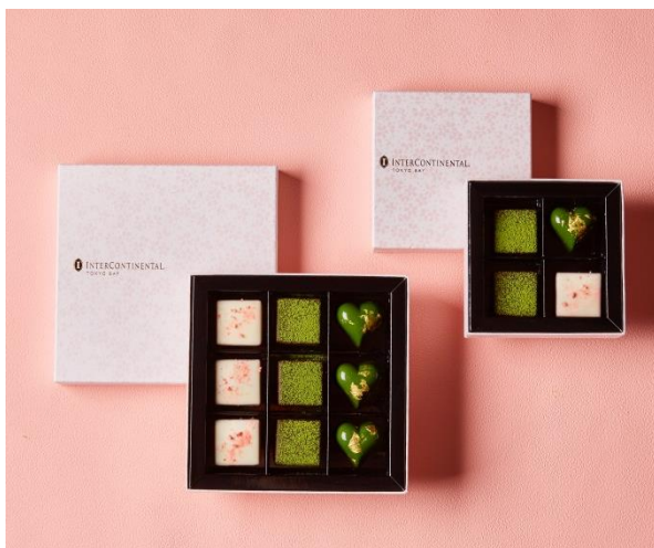
桜の花びらが散る美しい特製ボックスの詰め合わせ

ホテル インターコンチネンタル 東京ベイ(所在地:東京都港区海岸1丁目16番2号)では、ザ・ショップ N.Y.ラウンジブティックにて、桜の季節を感じさせる和菓子のような「桜ボンボンショコラ」が新たに登場いたしました。