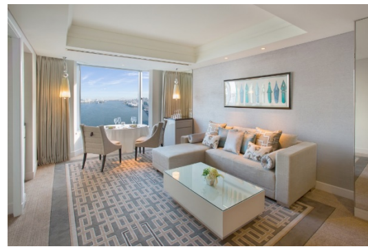
デユースプランではスイートルームも選べる

* アフタヌーンティーは11:30から提供開始、ラストオーダーは18:00となります。 内容は季節によって変わります。5月31日まで「HAPPYイースターアフタヌーンティー」を提供いたします。