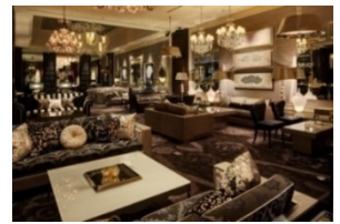
ニューヨークラウンジ 内観

上質なインテリアの中にゆったりとお掛けいただけるソファ席を配した華やかな店内では、見た目にも鮮やかな美食を提供します。一角に設けられたデザート工房「アトリエ・デセール」で仕上げられるアフタヌーンティーやパフェ、パンケーキなどのスイーツの他、サンドイッチやハンバーガー、各種御膳など、軽食からしっかりしたお食事までさまざまな用途に対応できるバラエティ豊かなメニューをご用意しております。各種アルコールも取り揃えておりますので、夜はバーラウンジとしてもお楽しみいただけます。