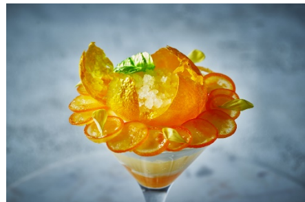
柚子の飴細工を割るとさらに柚子のグラニテが登場

https://www.interconti-tokyo.com/restaurant/news/parfait.html#ancmatchaparfait