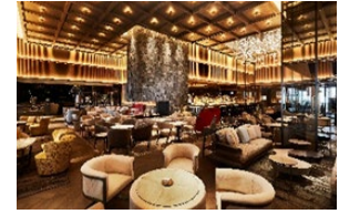
ハドソンラウンジ 内観

2020年6月27日グランドオープン「逢う・集う・囲む」をコンセプトにした開放的かつダイナミックなラウンジ&バー。天井高5mの「火を囲む暖炉のあるラウンジ」を空間の中心とし、7mのカウンターを備え、光と影が演出するアーティスティックで魅惑的なバーエリア「アンバー」と、ソファ席や洛中洛外図を設置したラウンジエリア、ライブラリーの落ち着いた雰囲気醸し出すエリア「ザ ライブラリー」、会食や接待、ミーティングにもご利用いただけるプライベートルーム「ライト」「エジソン」を完備した、人と人の交わる、当ホテルの新たなシンボルラウンジです。