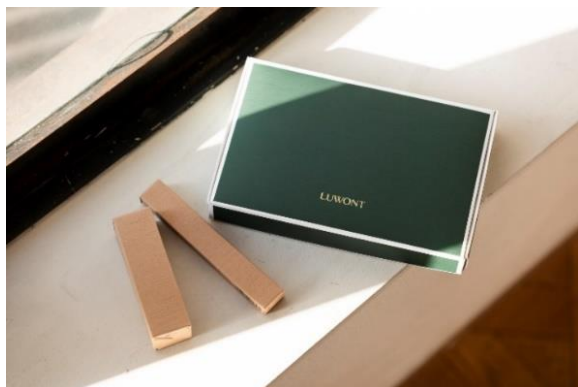
ルオント ベースクリーム 【BBクリーム】

【ルオント ベースクリーム&アイブロウスタイラー(ライトブラウン)セット ¥6,500(税込)】