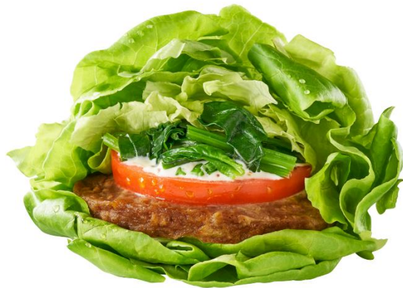
摩力堡（モー・リー・バオ） プラントベースほうれん草バーガーレタス

現在、台湾国内に304店舗（2023年4月末時点）を展開する台湾モスバーガーでは、国内におけるプラントベースフードへの需要の高まりを受け、これまでも代替肉を使用したメニューの開発・販売が行われてきました。そして今回、DAIZのコア技術である「落合式ハイプレッシャー法」により実現した、発芽大豆由来のミラクルミートの風味・食感を評価され、プラントベースバーガー新商品の『モー・リー・バオ』への採用に至りました。DAIZによる海外企業へのミラクルミート提供に関しては2022年4月に提供を開始したタイに続き、今回、台湾へ初進出となります。