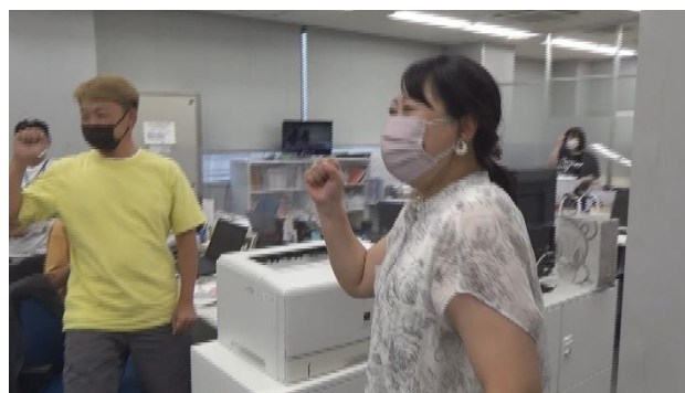
▲WEB ツールを活用してコンサルティングメソッドでもあるカエル会議を実施する様子 ▲制作部で断捨離をしている様子