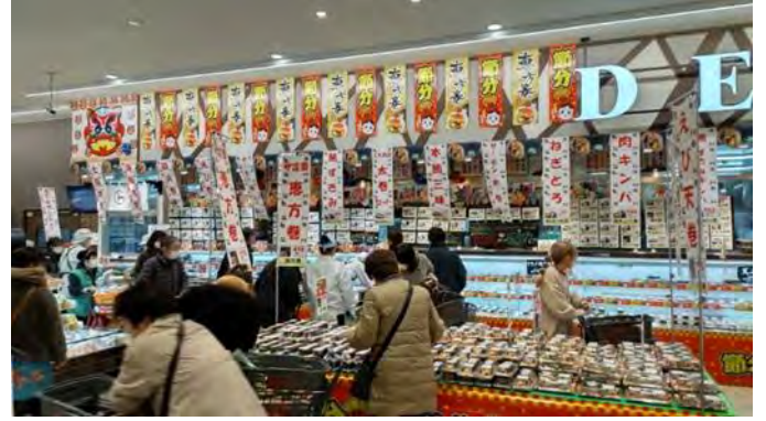
▲当日の店舗の様子