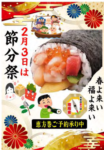
▲店頭 POP および予約注文用紙表面