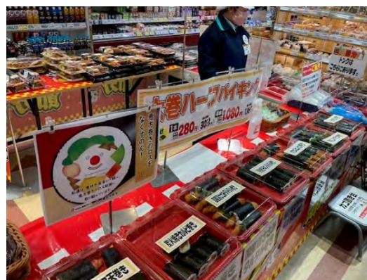
▲節分当日はハーフサイズを中心に販売。