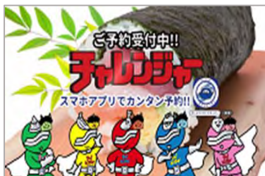
▲サイネージ・TVCMでの告知