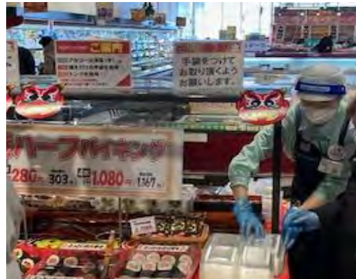
▲衛生面に気をつけて販売。