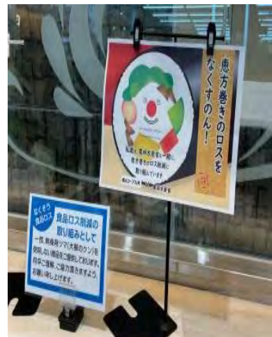
▲農林水産省資材による呼びかけ