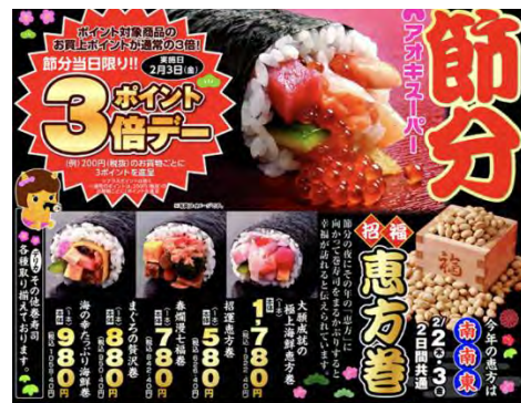
▲スマホアプリ掲載 イベント通知