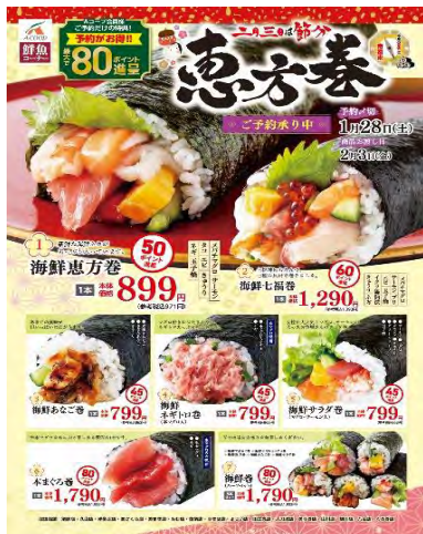
▲チラシにより予約を呼び掛け