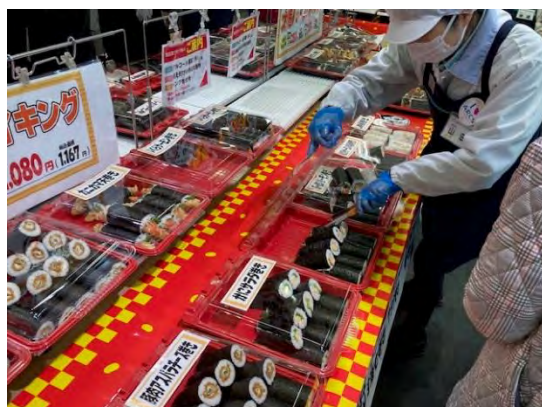
▲3日の当日は対面でバラ販売を実施。