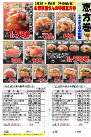
▲店頭予約注文用紙裏面およびスマホアプリ掲載