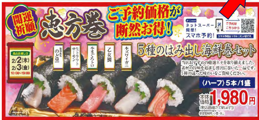
▲チラシ折込。ネットでの予約の推進。