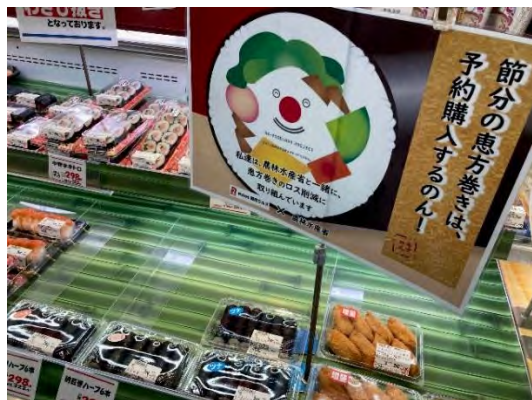
▲寿司コーナー予約推奨。前年比 117.3%。