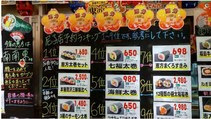
▲店舗で予約ランキングを公表