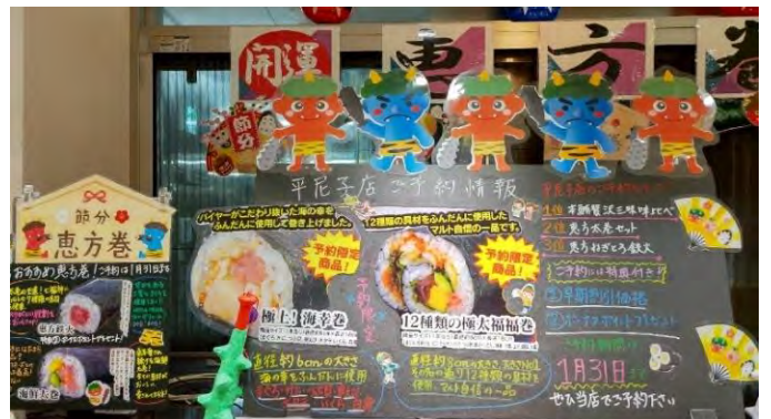
▲店舗でオリジナルの飾り付けを行い、予約をアピール