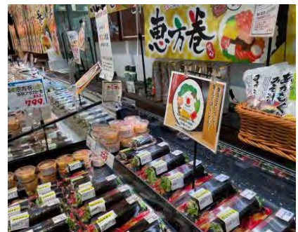
▲各店舗店頭での販売及びロス削減ポスター掲示の様子▲