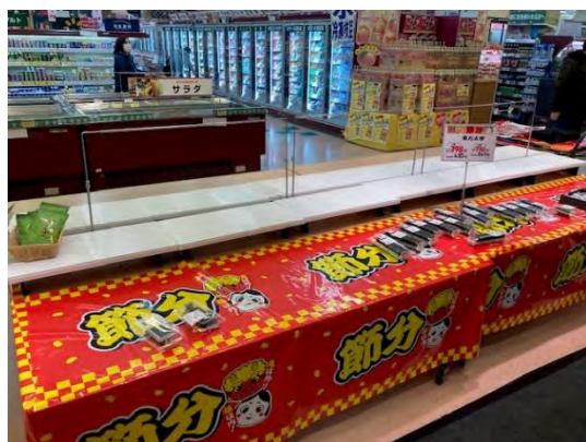
▲3日の20時にはほぼ完売。