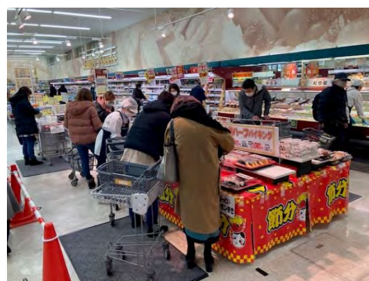
▲ハーフサイズが好評であった。