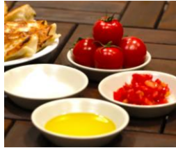
熊本県ご当地タレ