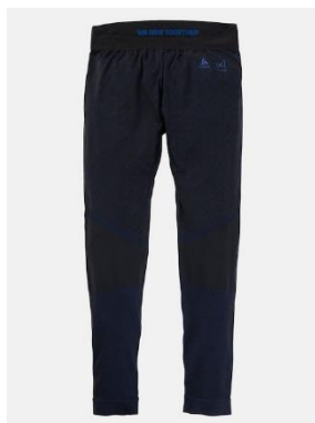
メンズ [ak] ® スローカー メリノ パンツ

¥ 18,000 (税込 ¥ 19,800) サイズ:S, M, L, XL, XXL