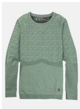
ウィメンズ [ak] ® スローカー メリノ ベースレイヤー クルーネック

¥ 18,000 (税込 ¥ 19,800) サイズ:S, M, L, XL, XXL