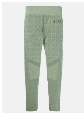
ウィメンズ [ak] ® スローカー メリノ パンツ

¥ 18,000 (税込 ¥ 19,800) サイズ:XS, S, M, L, XL