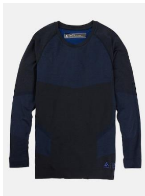
メンズ [ak] ® スローカー メリノ ベースレイヤー クルーネック

スイスを拠点とするブランド、Odloとのパートナーシップによりデザインされた、[ak] ® スローカー パフォーマンスウール 200 ベースレイヤークルー及びボトムスは、メリノのような快適な着心地と動きを妨げないリラックス感で、新しいスタンダードを打ち立てます。