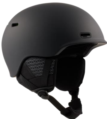
キッズ オスロー WaveCel ヘルメット

WaveCel による最先端の衝撃吸収テクノロジーを備えたオスロー。BOA® 360° フィットシステムによる簡単かつ素早い微調節により、よりその安全性能を発揮します。さらに、Polartec® フリースの使用で速乾性と温かさを備え、一日中快適な装着感を実現します。