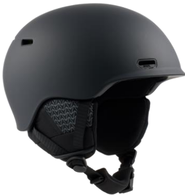
オスロー WaveCel ヘルメット