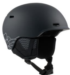
オスロ WaveCel® ヘルメット