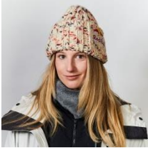
Anna Gasser アナ・ガッサー