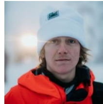
Red Gerard レッド・ジェラード