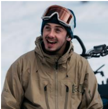
Mark McMorris マーク・マクモリス