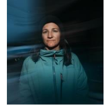
Kelly Clark ケリー・クラーク