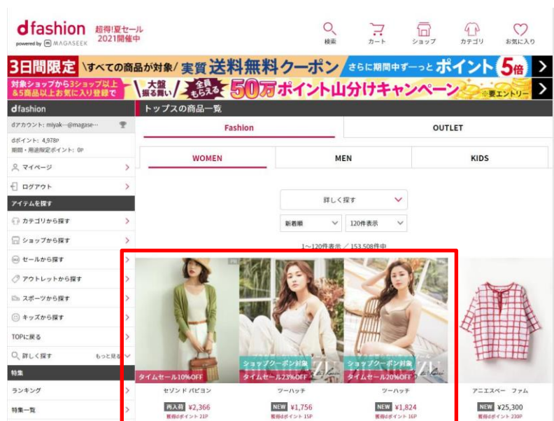
カテゴリー一覧掲載イメージ(PC)