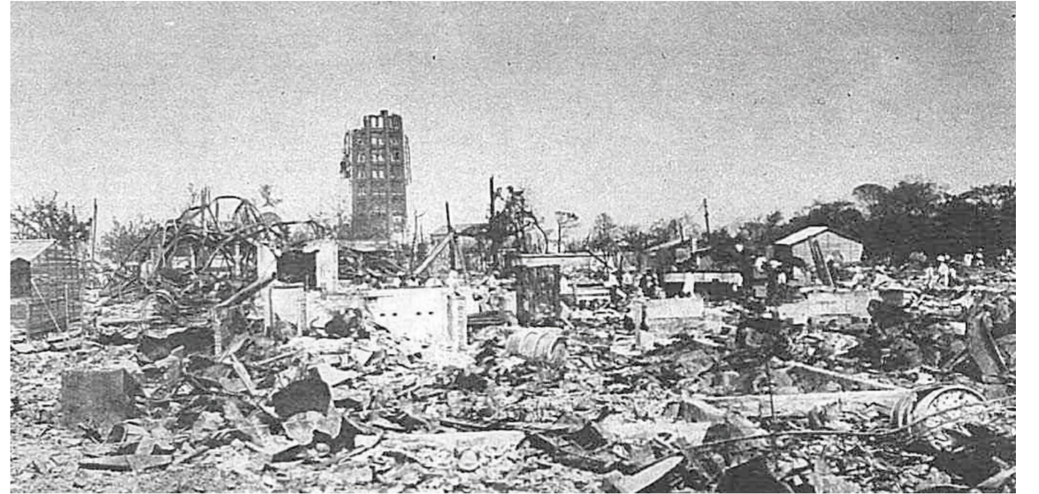
被災直後の9月7日に撮影された、倒壊した浅草の「凌雲閣」。12階建てが途中から折れている

今からちょうど100年前、「関東大震災」が関東地方をおそいました。屋食の準備で火を使っている家が多かったため、大火災の影響で死者や行方不明者が10万人を超えました。被害は東京だけでなく関東一帯に広がり、電気、水道、道路、鉄道などの生活に必要な基盤が壊滅的な被害を受けました。政府は地震が起きた9月1日を「防災の日」とし、学校や企業などで災害に備えた訓練が行われています。