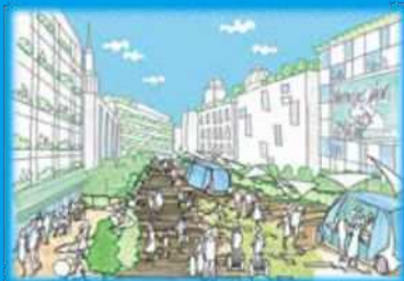
にぎわいと交流の場