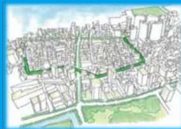
新しいみどりのネットワーク

再生に当たっては、植栽、アート等の導入、視点場の工夫や、日本の文化、有楽町・京橋・銀座・新橋など沿線地域の多様な個性をアピールするなどにより、世界から注目される観光拠点を目指します。