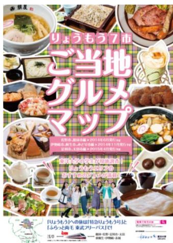
「りょうもう7市 ご当地グルメマップ」PRポスター

この連携で、東武鉄道のノウハウ等を参考に、東洋大学板倉キャンパスも近い両毛地区の新たな沿線誘客の可能性を検証できるほか、本学も地域活性化に関連する教育・研究の題材として実際に観光エリアの活性化策を検討できることなど、互いにメリットがあることから実現しました。