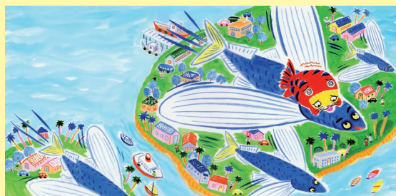
わたなべゆういち『ねござかなのおっこ』原画 2010