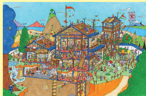
中垣ゆたか『にんじゃなんにんじゃ』原画 2017【寄託】