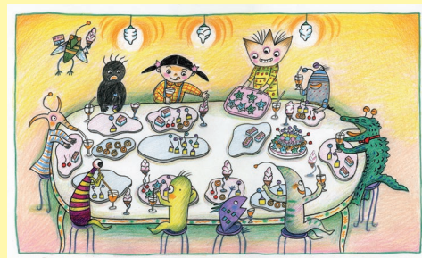
おぼまこと『ようこそおぼけパーティーへ』原画 2010