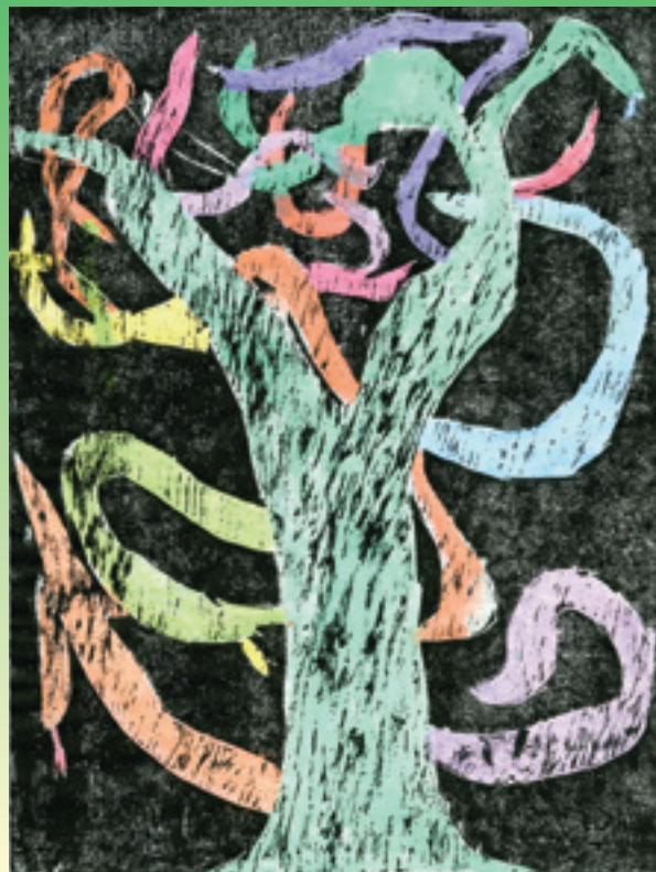
小学校図画工作展 出品作品 (小学4年生)

2021年 中学校美術作品展 1月15日(金)～1月24日(日) 1月18日(月)休館 小学校図画工作展 1月29日(金)～2月7日(日) 2月1日(月)休館