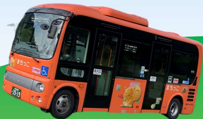
市民バス「まちっこ」