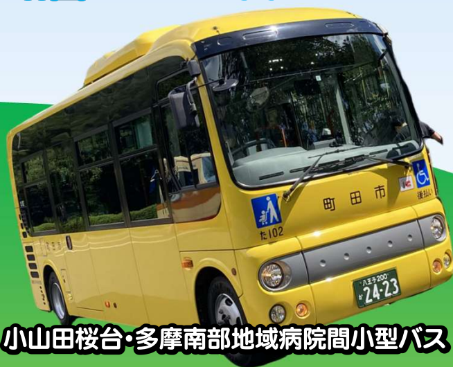
小山田桜台・多摩南部地域病院間小型バス