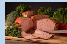
クロイツェルセレクト

※上記は一例です。インターネットサイト「ふるさとチョイス ガバメントクラウドファンディング」に掲載していますので、ご覧ください。