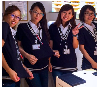
【店舗スタッフ着用イメージ】