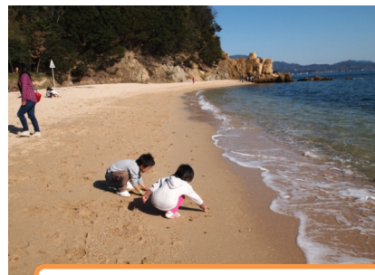
会場の横の海辺も楽しい♪