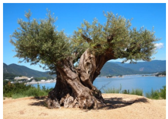
樹齢1000年のオリーブ大樹 (当社オリーブの森 EAST)