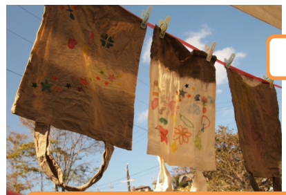
オリーブ染めでマイバックを！