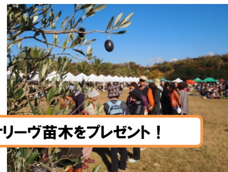
オリーブ苗木をプレゼント！