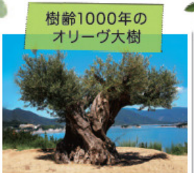
樹齢1000年のオリーブ大樹 1万km先のスペインからはるばるやって来た樹齢1000年のオリーブ大樹もぜひご覧ください。生命の息吹に満ちあふれています。小豆島にご来島の際はぜひご覧ください。

【お問い合わせ先】 小豆島ヘルシーランド株式会社 ☎0120-11-7677 (受付時間/月~土 AM9:00~PM8:00) 会場 〒761-4113 香川県小豆郡土庄町甲2721-1 当日のご連絡先は080-4037-5786まで広報担当(野村・大塚) 【主催】小豆島ヘルシーランド株式会社 【共催】NPO法人オリーブ生活文化研究所 【協力】株式会社ヒーロー、MeiPAM、日本ヘルシーランド株式会社、豊島オリーブアルス株式会社