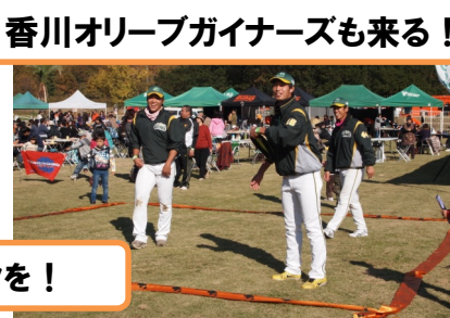
香川オリーブガイナーズも来る！