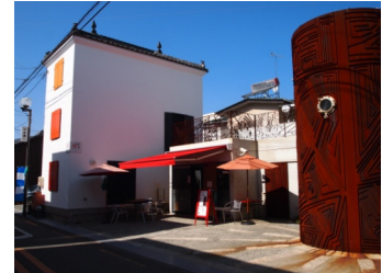
▲小豆島のアートギャラリー MeiPAM

瀬戸内の小豆島にある「迷路のまち」には、古い蔵や倉庫をリノベーションしたアートギャラリー「MeiPAM(メイパム)」があります。そこでは、とてもクオリティの高いアートの展示や、多彩な手作りのものが集まる「島マルシェ」で賑わい、最近注目を集めています。NaoPAM(ナオパム)は、その姉妹店。アートを求めて、島ならではの食を求めて来島される方が、直島の生活の歴史も感じながらゆったり楽しめる憩いの場としてオープンします。