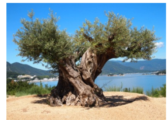
樹齢1000年のオリーブ大樹 (小豆島オリーブの森 EAST)