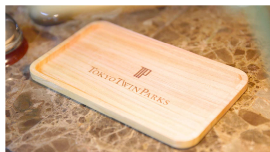
〈伐採樹木から製作した管理備品〉