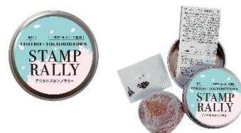
▲栽培キット「リトルハーブ」