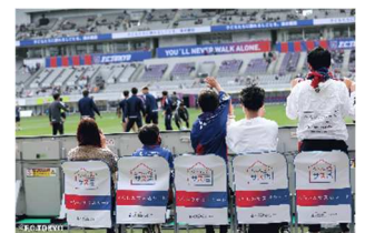
FC東京 ピッチサイドシート観戦チケット