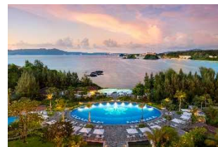
ハレクラニ沖縄 宿泊券