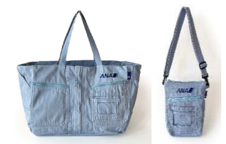
(右) ANA 整備士の作業着から作ったサコッシュ (左) ANA 整備士の作業着から作ったトートバッグ(大)