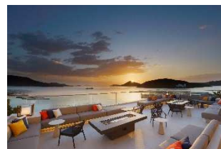
鳥羽国際ホテル 宿泊券