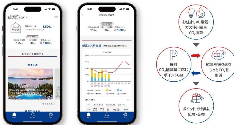
アプリ画面イメージ

今回のサービス提供により、すでに提供済の新築マンションおよび過去分譲済マンションを含めた利用可能な対象世帯数は 24 万世帯以上となります。今後、アプリサービスの登録受付を順次拡大し、お客様が日々のくらしを豊かに、楽しみながら、持続的に CO 2 削減に取り組んでいただける環境を提供してまいります。