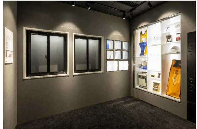
【共用部設備実機コーナー】