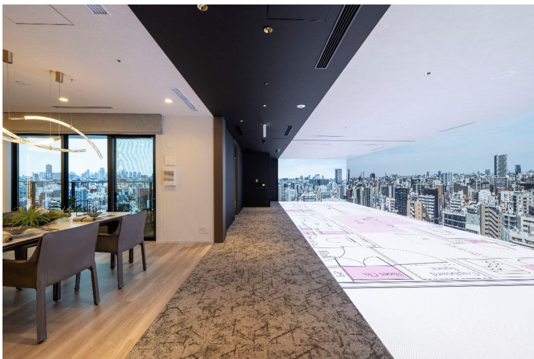
【大型 LED ビジョン/コンセプトルーム】

当社グループは今後もすまいと暮らしに関する多様なニーズに寄り添い、応えることで新たな付加価値を提供してまいります。