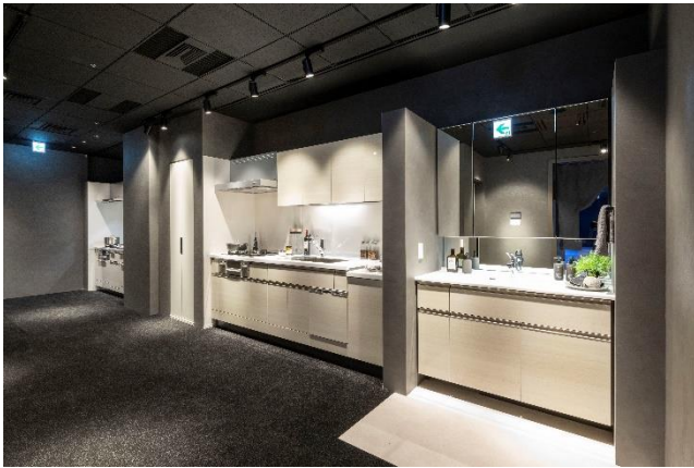
【専有部設備実機コーナー】

このほか、カラーセレクトコーナーでは大型モニターで室内カラーのCGイメージを確認しながら、建具や床材等のサンプル見本を手にとっていただき、より具体的なイメージをもってカラーセレクトをご検討いただけます。