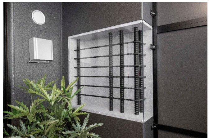
【建物構造のスケルトン展示】