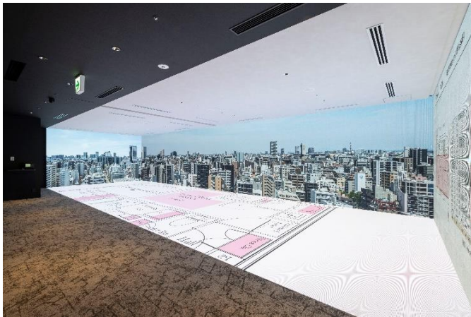
【大型 LED ビジョン（フルサイズ使用時）】

壁および床に配置された最大幅約 12m×4mの大型 LED ビジョンには、間取り図を実寸サイズで投影することが可能です。壁面ビジョンに眺望写真を投影し、住戸のリアルな広さと住戸内から見えるバーチャルな眺望を、没入感ある形で体感いただけます。また、今回新たに住戸タイプごとに実寸大の家具レイアウトを配置することが可能となりました。