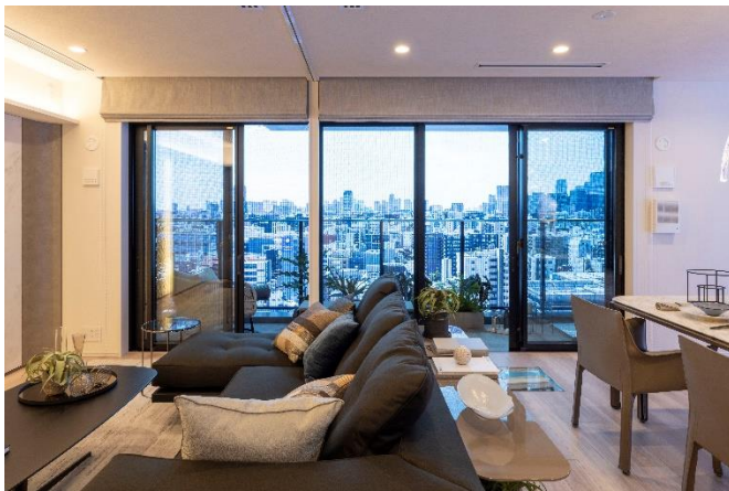
【コンセプトルーム】

さらに、建物構造部分の一部をスケルトンで展示。普段目にすることが出来ない建物内部を知っていただくことにより、当社の安心・安全の取り組みについてご認識を深めていただけます。