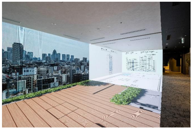
【大型 LED ビジョン（分割使用時）】