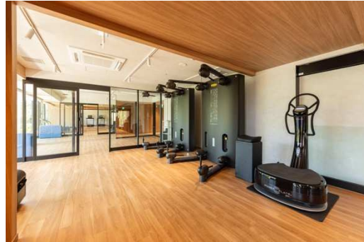
フィットネスジム