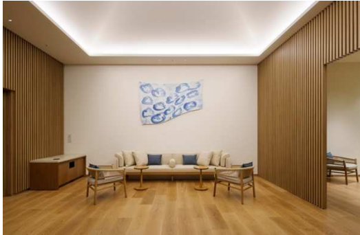
ウェルネスサロン

さらに、レジデンスに併設するスポーツ施設（ミズスポーツサービス株式会社運営）との連携も実施。入居者が専用で利用できる時間帯を設け、健康促進にとどまらず、新しい仲間との出会いや、新しい趣味と出会う機会を創出します。