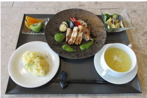
ダイニングメニュー