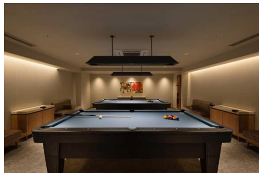
ビリヤードルーム