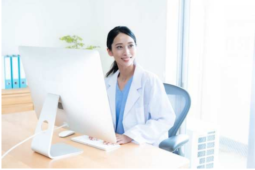
併設クリニックイメージ

また、将来介護ニーズが生じたときに備え、レジデンス内に介護専用フロアを用意しております。介護専用フロアには、専任ケアスタッフが 24 時間常駐し生活支援サービスを提供するとともに、外部の介護保険サービス（レジデンス内に開業する介護保険事業所が提供する介護保険サービスをご選択いただくことも可能）と連携することで、お一人おひとりの状態に応じたご生活をサポートいたします。