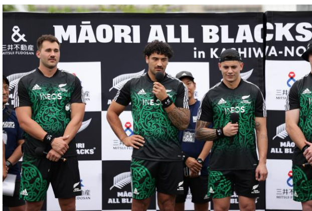
＜挨拶をする選手たち＞

子どもたちから選手にたくさんの質問が投げかけられましたが、中でも「どうしたら身体が強くなりますか?」という質問に対してラケテストーンズ選手は、「たくさん食べて、いっぱい運動することです。」とアドバイスを送りました。