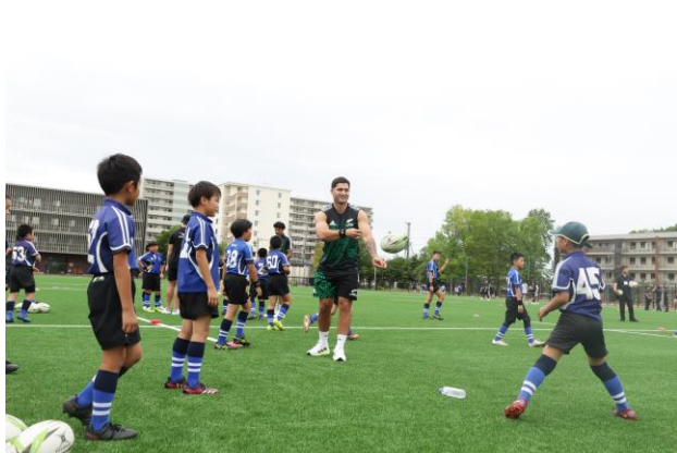
<パスを教える選手>

三井不動産は今後も、リージョナルパートナーとして NZR と手を携え、子どもたちの夢を育み、スポーツ振興や国際化の推進、地域の活性化につながる「感動体験」を創出し、「スポーツ・エンターテインメントを活かした街づくり」を進めていきます。