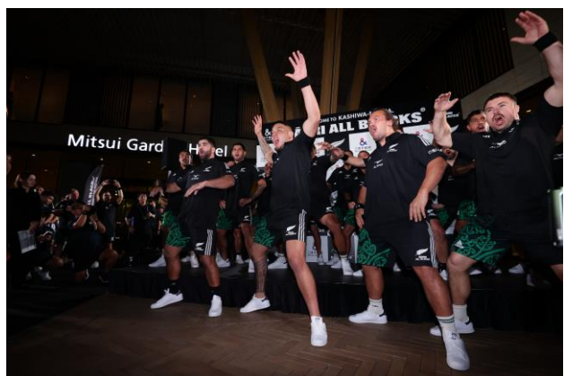
＜マオリ・オールブラックス選手による「ハカ」＞