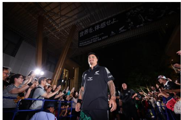
＜ウェルカムセレモニーの様子＞