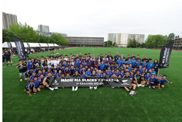
<ドリームスクール終了後の全体集合写真>