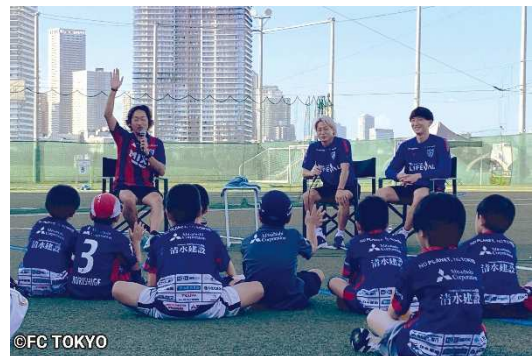
<特典例> FC 東京サッカー教室