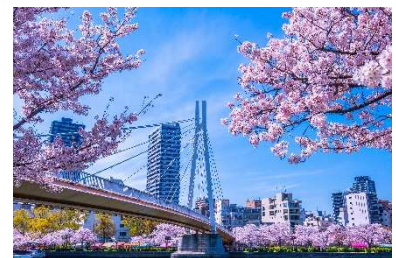
【桜開花時期の大川の河畔】