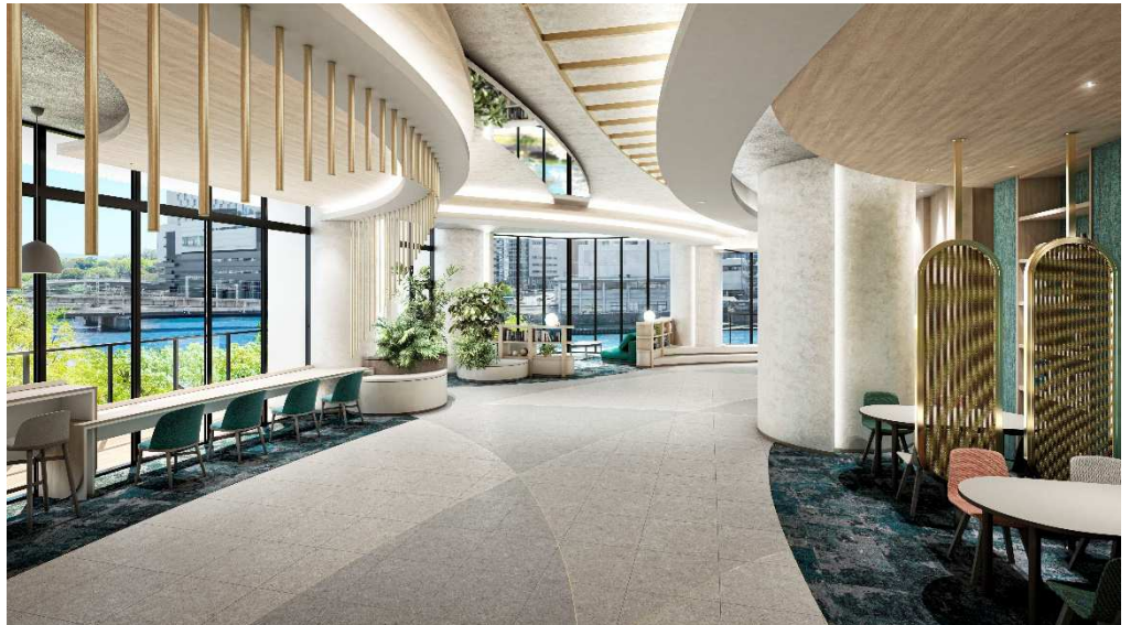
【3階ラウンジ完成予想図】