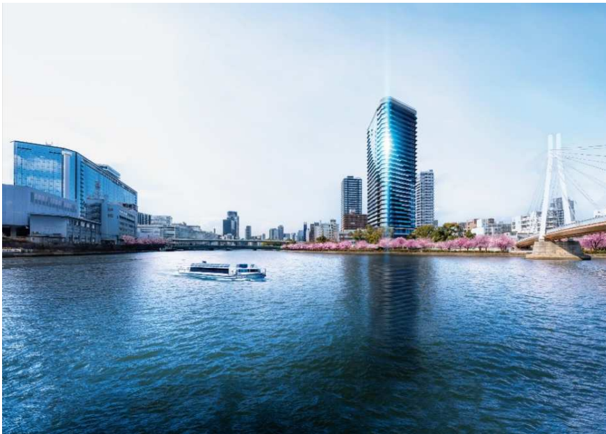
【大川越しに望む外観完成予想図】

私どもは今後も、多様化するライフスタイルに応える商品・サービスを提供するとともに、安全・安心で快適にくらせる街づくりを推進し、持続可能な社会の実現・SDGsへ貢献してまいります。