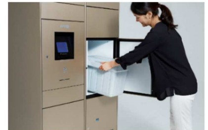
【冷凍冷蔵宅配ロッカー イメージ写真】

昨今、物流業界で懸念されている「2024年問題」への対策として、日本初（※3）となる「株式会社フルタイムシステムの冷凍冷蔵宅配ロッカー」を導入、冷凍品・冷蔵品にも対応します。また、高層階住戸には各戸専用の宅配ロッカーを設置することで物流業界の配送効率化に寄与することを目指しています。さらに、メールコーナーには段ボールの解体やDM等を仕分けできる荷捌きスペースを設置するなど、居住者の利便性向上を図ります。