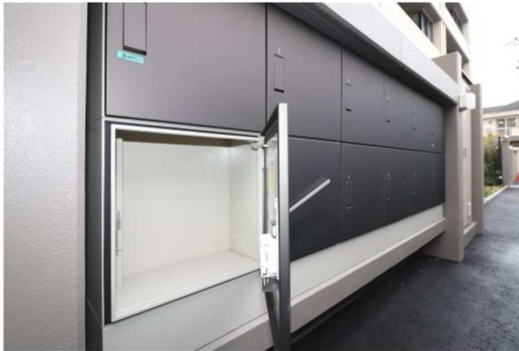
【マルチボックス施工事例】

本物件は城北エリア最大の運動公園である城北中央公園に近接しております。屋外での趣味や遊びを最大限楽しんでいただくために、充実した収納を用意しました。駐輪場にはコンセントも付いたマルチボックスを設置。電動自転車のバッテリーを部屋にもって上がらずに充電することや、汚れやすい趣味の道具や子供の遊具を保管しておくことができます。バイク置き場には工具などを収納できる吊り収納を設置。1階全住戸には地下収納もしくは床下収納が設置されており、一部住戸には土間収納を用意するなど、アウトドアのかさばる道具なども保管しておけるスペースを確保しています。