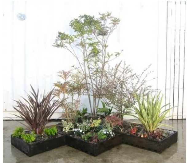
【薄層緑化マット「安行四季彩マット」】