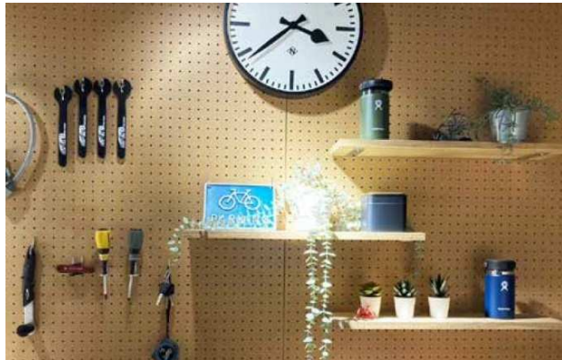
【土間収納イメージ】