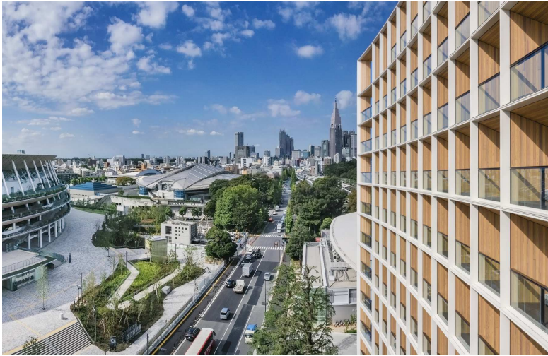
【SUSTIMBER 施工事例： 三井ガーデンホテル神宮外苑の杜プレミア】

兼松サステック株式会社の防腐・防蟻処理用木材保存剤「ニッサンクリーン AZN」で加圧式保存処理した国産スギ材に住友林業株式会社の木材保護塗料「S-100」を施した建材である「SUSTIMBER（サスティンバー）」を用いることで、木材の風合いを残しながらもメンテナンス性を高め、当社で初めて新築分譲マンションで天然木を外装材利用することを可能にしました。なお、この製品は、三井ガーデンホテル神宮外苑の杜プレミアの外装にも利用されており、撥水性・防汚性やメンテナンス性に優れた製品です。