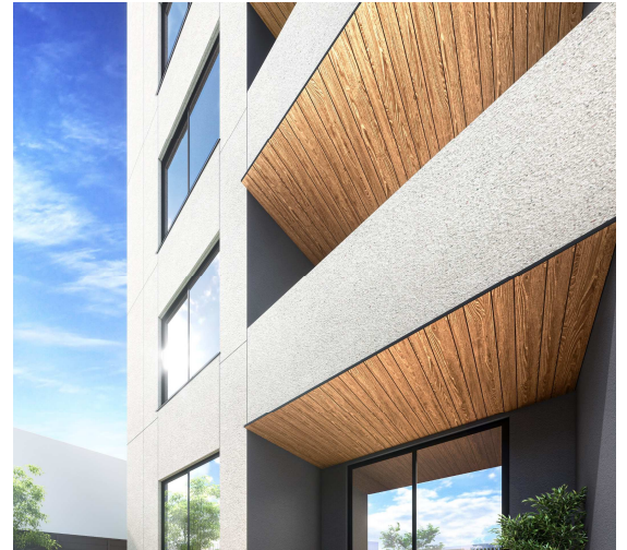
【SUSTIMBER を使ったバルコニー軒天】