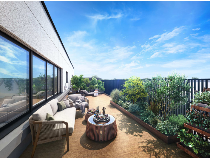
【ルーフバルコニー完成予想 CG】

また、設置する樹種について、周囲の緑と調和する日本原産の樹種とおしゃれで華やかな印象のオージー系の樹種の 2 種類から選択することができ、お客様好みのルーフバルコニーをお作りいただけます。