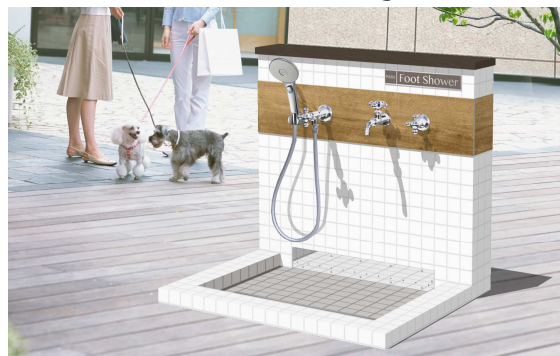
【ペット対応マルチ水栓イメージ】