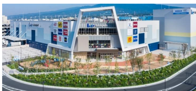
三井ショッピングパーク ららぽーと沼津 (静岡県沼津市)