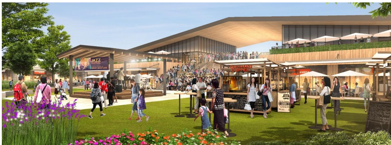
「(仮称)三井アウトレットパーク 岡崎」屋外広場 CG

当施設では、アウトレットショッピングを楽しんでいただけるバリエーション豊富な約 170 店舗が集積するほか、緑豊かな屋外広場を整備するなど居心地の良い環境創出をいたします。また、CO2 排出量の削減など、持続可能な社会の実現にも取り組んでまいります。