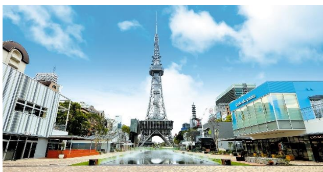
RAYARD Hisaya-odori Park (愛知県名古屋市)