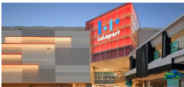
三井ショッピングパーク ららぽーと名古屋みなとアクルス (愛知県名古屋市)