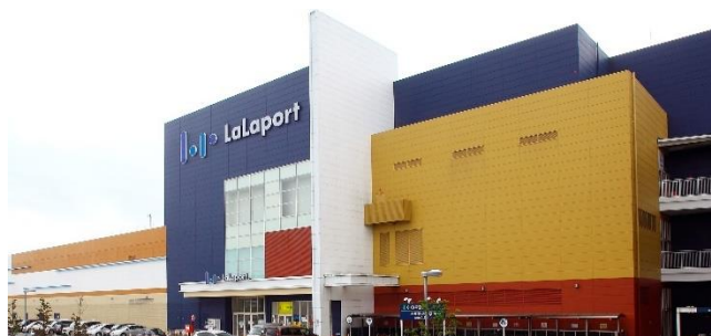
三井ショッピングパーク ららぽーと磐田 (静岡県磐田市)