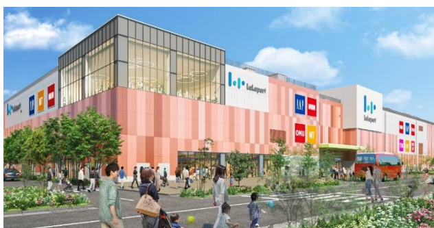
(仮称)三井ショッピングパーク ららぽーと安城 CG (愛知県安城市)