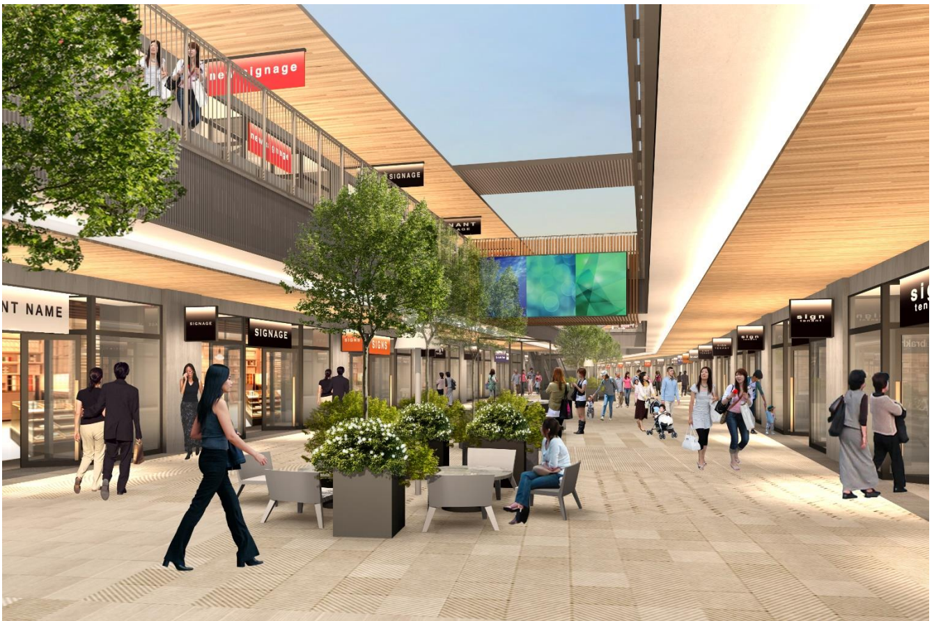
「(仮称)三井アウトレットパーク 岡崎」 モール内 CG

太陽光パネルの設置や高効率設備の採用、省エネアイテムの導入などにより、CO2 排出量の削減をはじめとした ESG 課題の解決に取り組んでまいります。