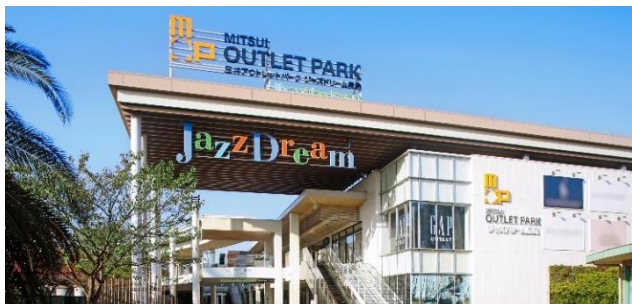
三井アウトレットパーク ジャズドリーム長島 (三重県桑名市)

なお、当施設開業と同年の2025年春には「(仮称)三井ショッピングパーク ららぽーと安城」の開業やららぽーと名古屋みなとアクルスの開業後初のリニューアルを予定しており、東海エリアのお客さまにより一層楽しんでいただける施設を展開してまいります。「Growing Together」という当社商業施設のコンセプトのもと、地域に根差し、お客さまとともに育んでいく商業施設の新しいカタチの実現に向けて、施設間での連携を図りながら、今後も様々な取り組みを進めてまいります。