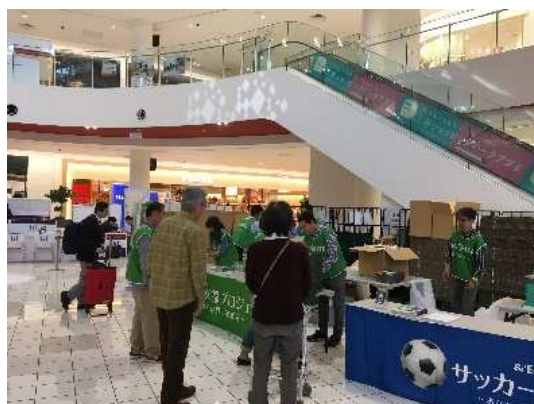
会場でのサッカー用品回収の様子