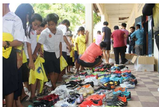
カンボジアでのサッカー用品寄贈の様子(2023 年 6 月)