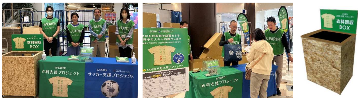
前回の衣料品回収風景(2023年10月)

・実績の詳細については JRCC のホームページ上( http://www.jrcc.or.jp/ )にてご確認ください。