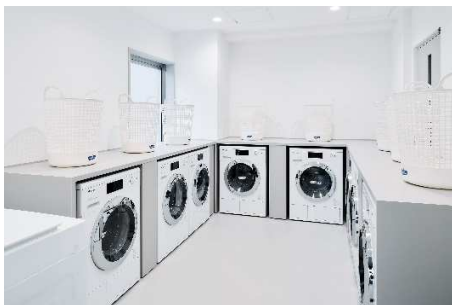
ランドリールーム