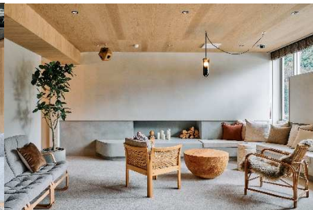
ファイヤープレース