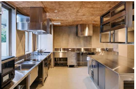
キッチンスタジオ