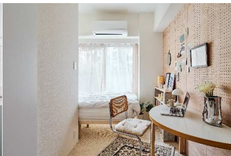
居室（モデルルーム）