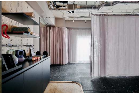
トレーニングルーム