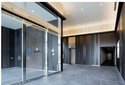
メインエントランス

また、ワーカークの働きやすさを追求し、快適に休憩しリフレッシュできるラウンジを 4 階の東西に計 2 か所設置。ラウンジにおける Wi-Fi の提供、24 時間無人コンビニを導入し、快適で働きやすい環境を提供いたします。