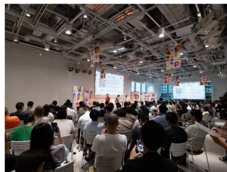
「POTLUCK FES'23 Autumn」の様子