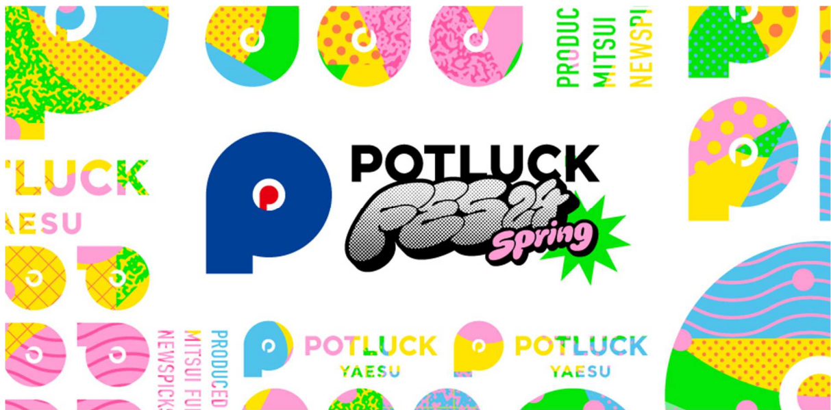
「POTLUCK FES'24 Spring」のキービジュアル

詳細は「POTLUCK FES'24 Spring」公式WEBサイト( https://fes.potluck-yaesu.com )よりご覧ください。