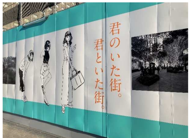
アートエキシビジョンの様子