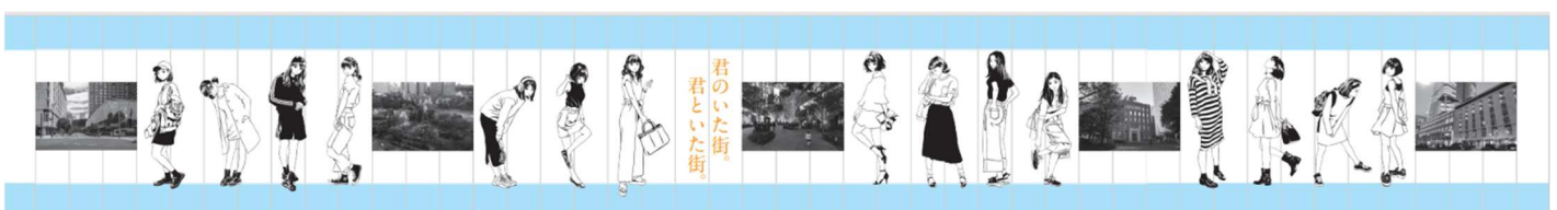
アートエキシビジョン全体(原画)