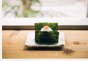
天地人米の塩おむすび

ウミトロン株式会社、株式会社サガミホールディングス、株式会社サガミホールディングス、株式会社天地人