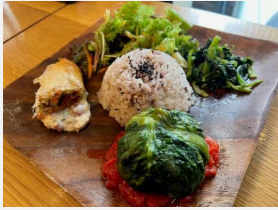
サバとパート・フィロ包み焼きの宇宙プレート

キッコーマン食品株式会社、キュービー株式会社、サナテックシード株式会社、宝食品株式会社、有限会社十勝スロウフード、株式会社プランテックス、株式会社ホテイフーズコーポレーション、三基商事株式会社、森永乳業株式会社、理研ビタミン株式会社、株式会社ロッテ、福井県立若狭高等学校