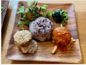
サバのコロッケとハンバーグの宇宙プレート