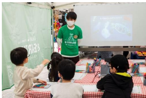
【2023 年 3 月「&EARTH 教室」の様子】

※前回 2023 年 3 月開催時は、各回満員の計 110 名のお子様にご参加いただきました。