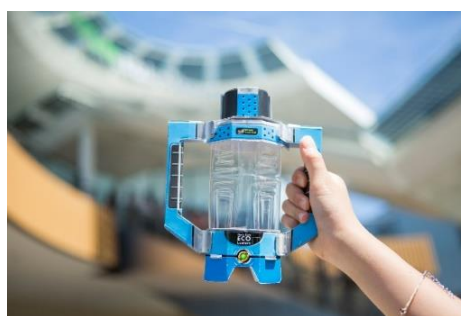
【オリジナル「ソーラーらんたん」イメージ】