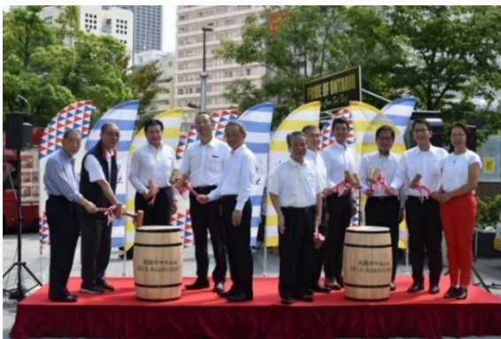
【10周年セレモニーの様子】

地元関係者にご列席いただき、ワイン樽の鏡開きをしました。登壇者の皆様にご挨拶いただき、「太陽のマルシェ」の10周年をお祝いしました。