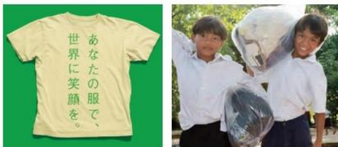
【「&EARTH 教室衣料回収プロジェクト」イメージ】