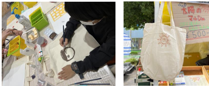
【「不用コスメから作った絵具でマイエコバッグをつくろう」ワークショップイメージ】