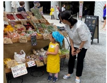
【「キッズマルシェ」の様子】