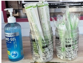
【環境に配慮したカトラリー】