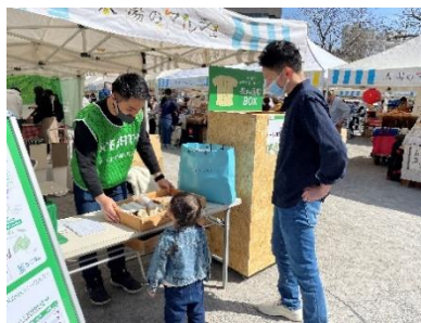
【これまでの&EARTH 衣料回収プロジェクトの様子】