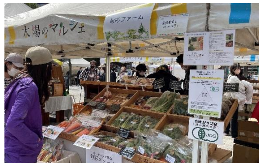
【これまでの「太陽のマルシェ」の様子】