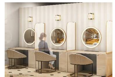
コスメカウンターは、明るさを調節可能なミラー付き

なお、本ショールーミングショッピングゾーンでは、&mall等で販売している通常商品に加えWEB限定品や先行予約品等の展示も行う予定です。