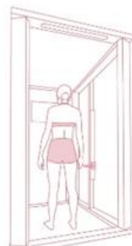
瞬時に体型計測が可能

その場で体型測定するというリアル施設ならではの利点と、3D計測サービスによる瞬時かつ正確な計測・分析というデジタル技術を活用し、お客さまのお洋服選びの質の向上をお手伝いします。また、定期的にご利用いただくことで、体型の変化等の把握に役立てていただくことが可能です。