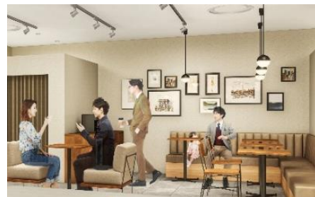
コーヒーやジュースなどが楽しめるカフェラウンジ