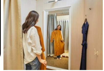
受け取った商品はその場で試着可能(返品無料)