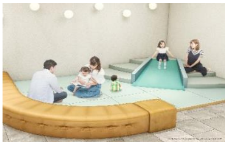
滑り台もあるラウンジ内キッズスペース

キッズスペースに隣接しているため、ご家族はお子さまを見守りながらお好きな飲み物を楽しんでいただけます。もちろん、お子さま向けのドリンクもご用意しております。