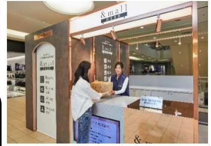
&mall 購入商品を送料無料で受け取り可能