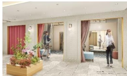
ベビーカーや家族づれでも入れる広い試着室

ベビーカーに乗ったお子さまと一緒にゆったりと試着いただけるだけでなく、ご家族やご友人同士でご試着を一緒に楽しむこともできます。