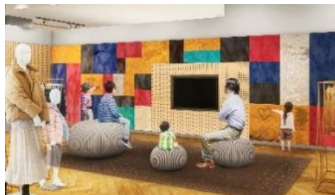
遊び壁や大きなクッション等を備えたキッズスペース