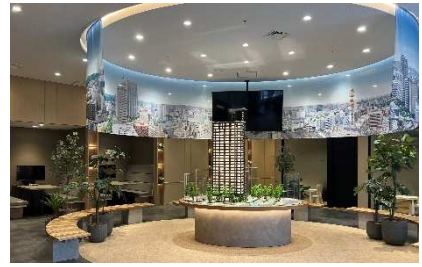
【仙台一番町レジデンシャルサロン】

本物件は、東北地方のマンションで当社初となる BELS 認証における「ZEH-M Oriented」の取得を予定。ZEH-M Oriented 基準の断熱性及び住設機器の設置により、室内の消費エネルギー量を低減、電気代等も抑えられ、地球環境はもとより家計にもやさしいマンションを目指します。さらに、販売センターの一部部材には、地元宮城県産の木材を使用することで、森林資源の循環に寄与して参ります。