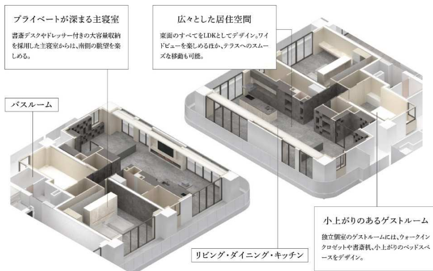
【プレミアムフロア CG イメージ図】

専有部においては、単身からファミリーといった幅広いターゲットを見据えて 1LDK~4LDK（全 15 タイプ）のプランバリエーションを取り揃えました。また、24 階・25 階は他の階よりも広く、天井も高いプレミアムフロアを設定しています。プレミアムフロアは計 4 タイプの住戸をご用意しており、いずれも 100 m 2 を超える商品ラインナップとなっています。また当プレミアムフロアの住戸には、世界を舞台に活躍する建築家・阿部 仁史氏が手掛けた限定メニュープランをご用意。杜の都の原風景を取り入れたデザインや、機能美あふれる壁面装飾、そして天井の高低差を活かした照明計画など、上質なプライベート空間に仕上げています。