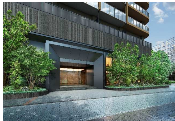
【エントランスアプローチ完成予想 CG】