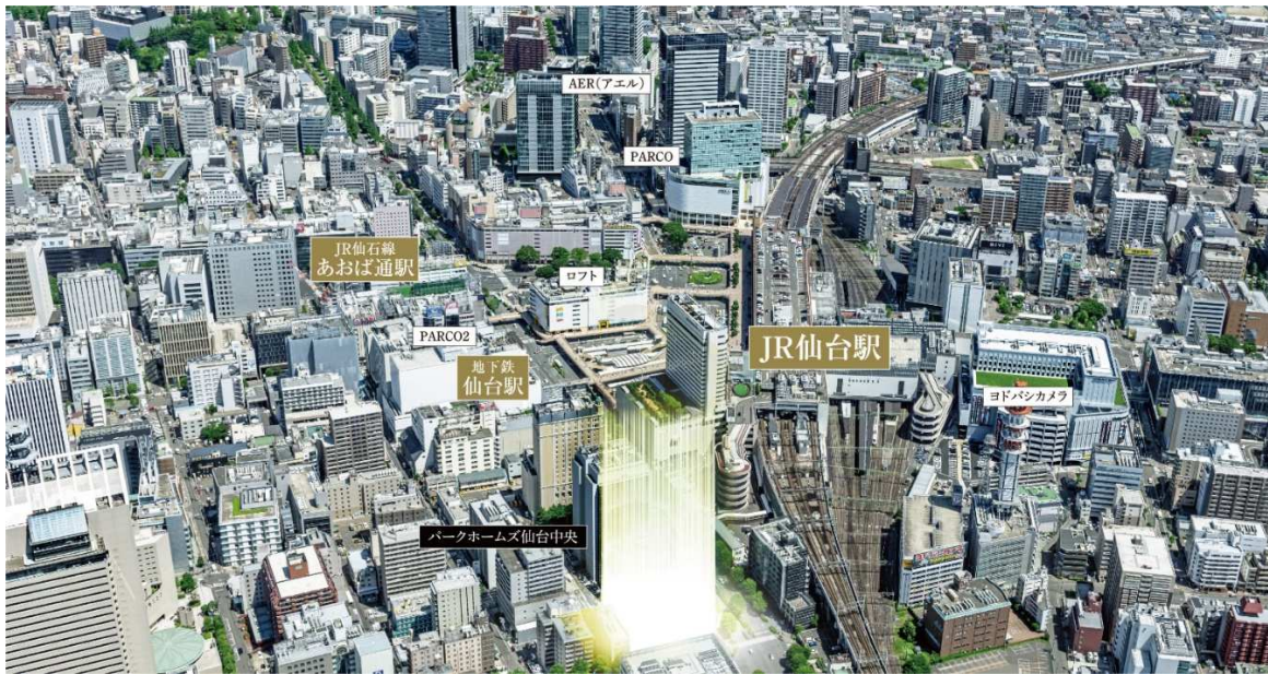
【現地周辺航空写真】

本物件は、JR「仙台」駅徒歩 5 分、仙台市交通局地下鉄東西線・南北線「仙台」駅徒歩 3 分と仙台市のなかでも特に交通利便性に優れた場所に誕生します。ここは、「仙台 PARCO」や「S-PAL 仙台」といった駅前の大規模商業施設等が集積するエリアでありながら、愛宕上杉通と北目町通という 2 つの並木道が交差する角地立地のため、杜の都ならではの緑を身近に感じられるロケーションが魅力です。さらに、本物件は JR「仙台」駅徒歩 5 分以内に位置する免震構造マンションとして約 10 年ぶりの供給です。長いスパンで考える分譲マンションだからこそ、時代に合った安全性を追求してまいります。