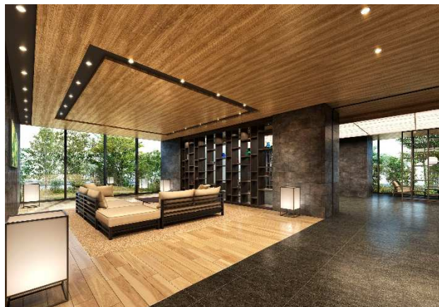
【エントランスラウンジ完成予想 CG】