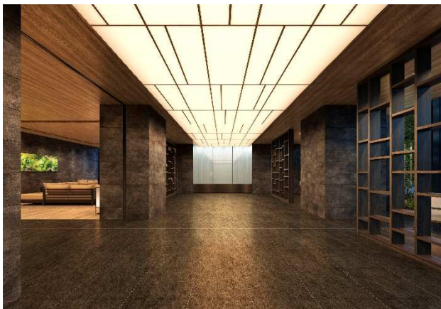
【エントランスホール完成予想 CG】

共用部にはエントランスホールとラウンジをご用意しています。デザインにおいては「ホスピタリティを感じる迎賓空間」をイメージし、仙台城の石垣を思わせる壁面や秋保大滝の水面と重なるガラス装飾、障子や縁側といった日本古来のモチーフを随所に取り入れています。