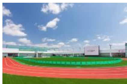
三井ショッピングパーク ららぽーと福岡