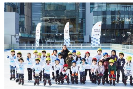
三井不動産スポーツアカデミー (アイススケートアカデミー)