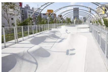
MIYASHITA PARK (東京都渋谷区)

2024年春には収容人数1万人規模の大型多目的アリーナ施設「(仮称)LaLa arena TOKYO-BAY」(株式会社MIXIとの共同事業)の開業も控えており、今後も「スポーツの力」を活用した街づくりを推進してまいります。