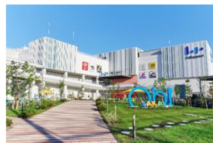
三井ショッピングパーク ららぽーと堺 (大阪府堺市)