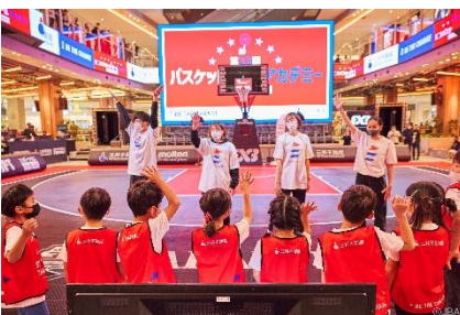
三井不動産スポーツアカデミー (バスケットボールアカデミー)