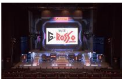
東京ドームシティ シアターG ロッソ