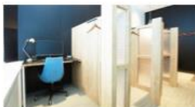
ワークスタイリング札幌