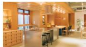
PARK AXIS 錦糸町スタイルズ