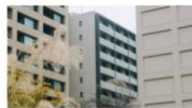
PARK AXIS 日本橋茅場町