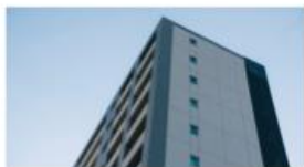
PARK AXIS 神楽坂・早稲田通り