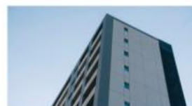
PARK AXIS 池袋