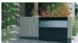
PARK AXIS 本所吾妻橋 サウスレジデンス