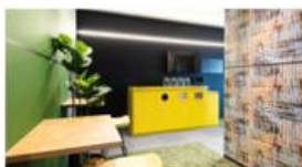
ワークスタイリングSOLO 錦糸町 ワークスタイリング秋葉原昭和通