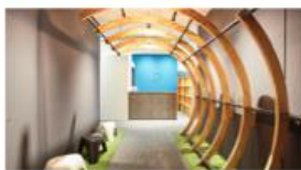
ワークスタイリング豊洲 ワークスタイリングSOLO 豊洲