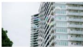
PARK AXIS 豊洲キャナル