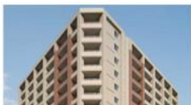
PARK AXIS 札幌植物園前