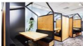
ワークスタイリング飯田橋