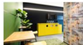
ワークスタイリングSOLO 錦糸町 ワークスタイリング秋葉原昭和通