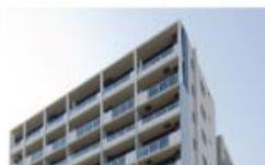
PARK AXIS 六本松