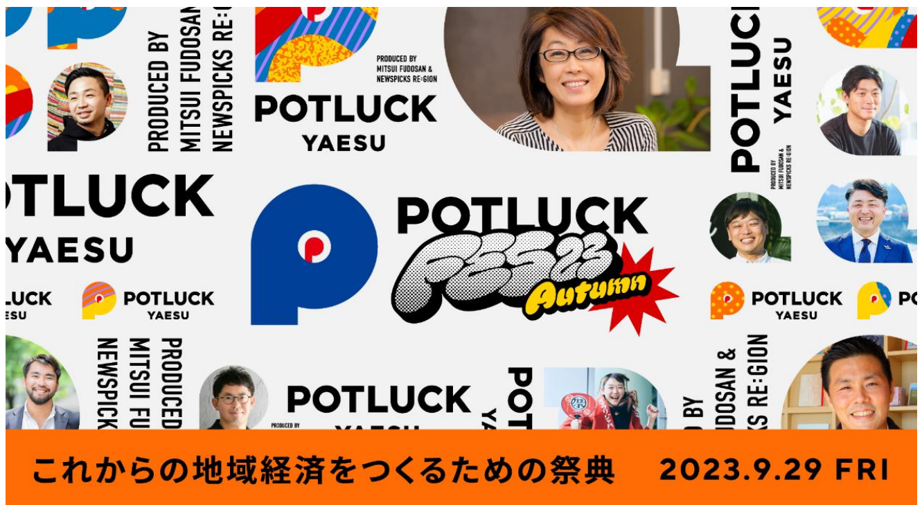
「POTLUCK FES'23 Autumn」のキービジュアル

詳細は「POTLUCK FES'23 Autumn」公式WEBサイト( https://fes2023.potluck-yaesu.com/ )よりご覧ください。