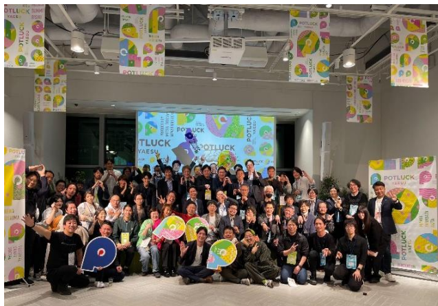
第1弾イベント「POTLUCK FES'23 spring」開催の様子