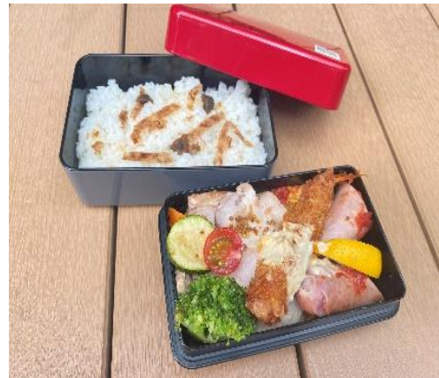
「+R Smart Lunch Box」イメージ

※ 「COREDO シェアステデリバリー」とは、NECソリューションイノベータが開発するデジタルサイネージシステムとスマートフォン配信の仕組みを用いて、「COREDO 日本橋」や「COREDO 室町」などの飲食店のランチメニューをCOREDOシェアステデリバリーのLINE公式アカウントで注文をとりまとめ、三井不動産グループが運営・管理する日本橋室町エリアを中心としたオフィスビルに集約配送するサービスです。