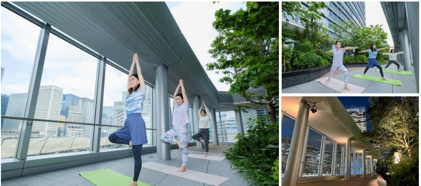
「YAESU Wellness Weeks」朝・夜のイメージ

東京ミッドタウン八重洲（所在地：東京都中央区 管理者：三井不動産株式会社）では、施設5階にある「YAESU TERRACE」にて、健康やボディメイクをサポートするヨガ & ワークアウト体験プログラム「YAESU Wellness Weeks」を6月15日(木)～7月1日(土)に開催します。