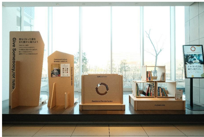
マンション共用部における常設型の不要品回収ステーション（パークアクシス豊洲キャナル）

今後も、三井不動産レジデンシャルの全住宅事業のブランドコンセプトである「Life-styling × 経年優化」のもと、多様化するライフスタイルに応える商品・サービスを提供するとともに、安全・安心で快適にくらせる街づくりを推進し、持続可能な社会の実現・SDGs へ貢献してまいります。