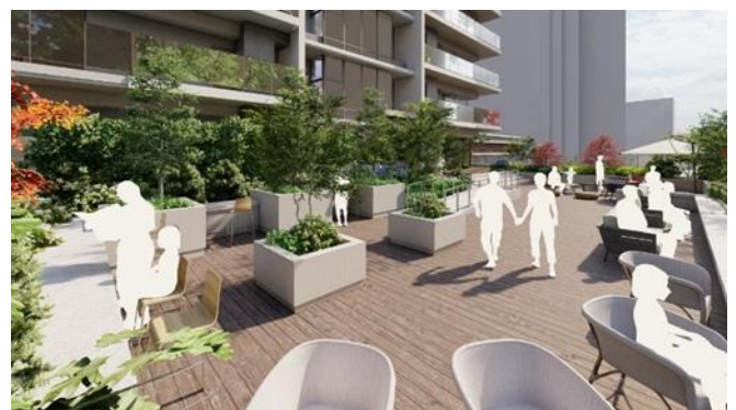
2 階屋上テラス完成予想 CG