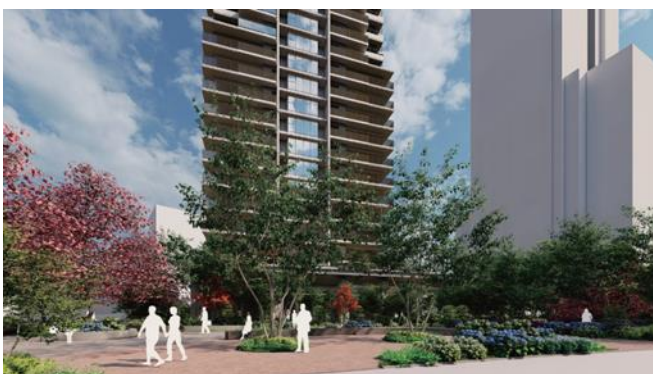
1 階広場完成予想 CG