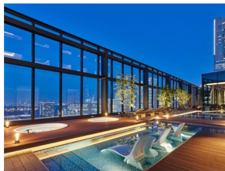
sky pool LA MAGNOLIA(スカイプール ラ マグノリア)(屋内・屋外)