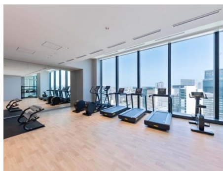
フィットネスジム